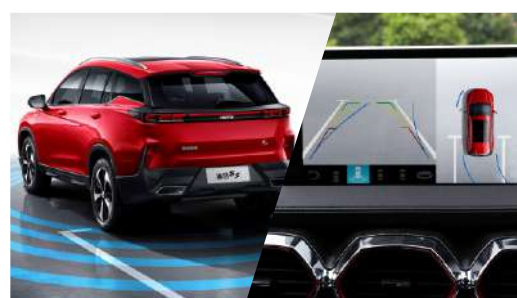
КАМЕРА КРУГОВОГО ОБЗОРА