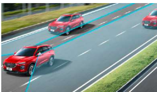
СИСТЕМА ОБНАРУЖЕНИЯ СЛЕПЫХ ЗОН (BSD)