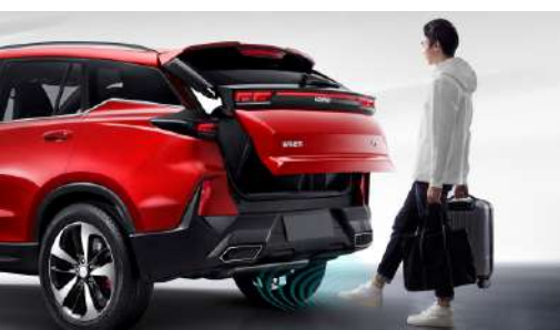
БЕСКОНТАКТНОЕ ОТКРЫВАНИЕ БАГАЖНИКА ДВИЖЕНИЕМ НОГИ