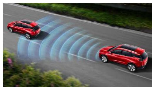
АДАПТИВНЫЙ КРУИЗ-КОНТРОЛЬ (ACC)