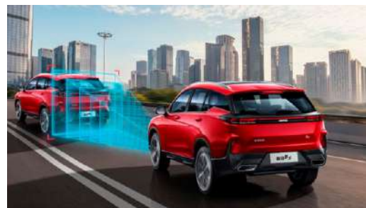
СИСТЕМА ПРЕДУПРЕЖДЕНИЯ О ЛОБОВОМ СТОЛКНОВЕНИИ (FCW)